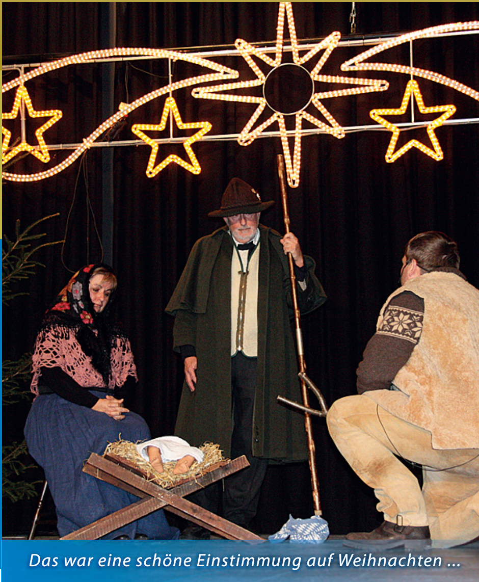
Das war eine schöne Einstimmung auf Weihnachten ...