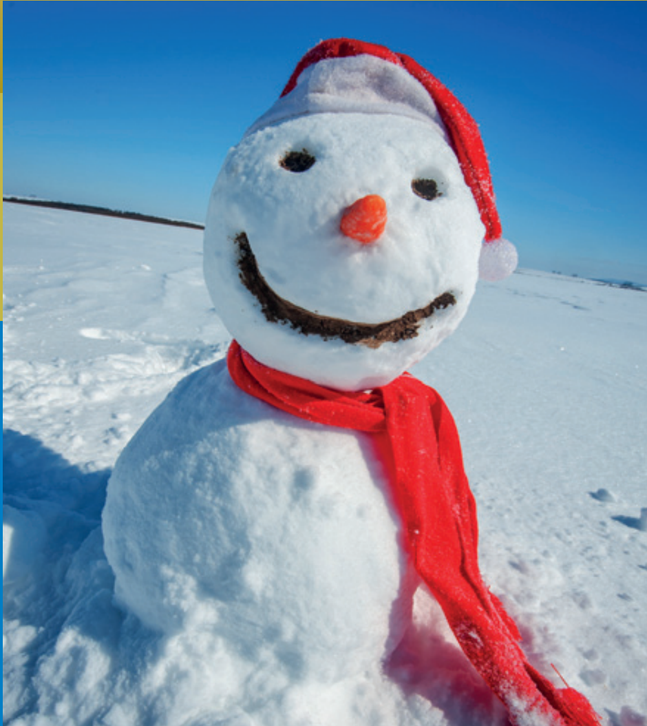
Ein Schneemann war heuer schon drin ...