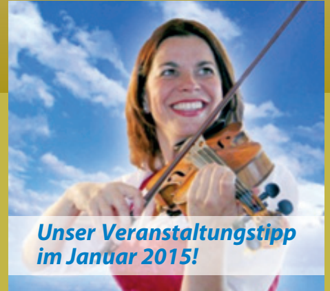
Unser Veranstaltungstipp im Januar 2015!