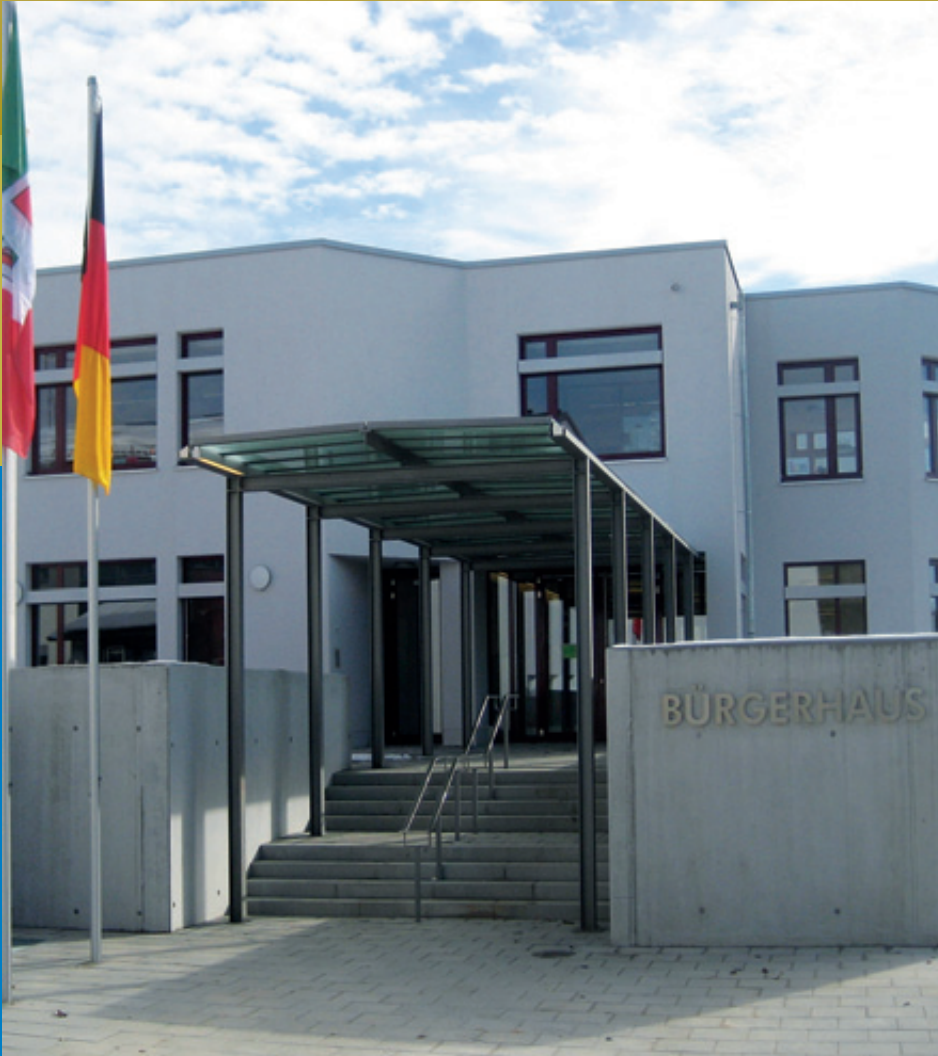
40 Jahre Bürgerhaus Putzbrunn - Welch' Pracht ...