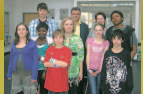
Mitglieder des Jugendbeirates des Clemens-Maria-Kinderheimes zu Besuch im Rathaus