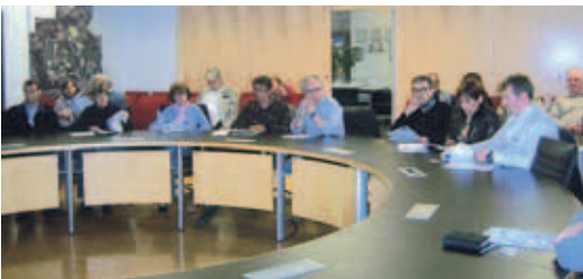
„Informations- veranstaltung BürgerSolarKraftwerke“

Leistung von etwa 4 kWp (*) entsprechen. Der Interessent müsste hierfür etwa 11000 Euro investieren. Dies entspräche einer Anlagesumme von 22 Anteilen á 500 Euro für das partiarische Darlehen.