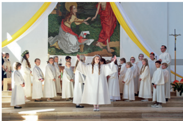
Erstkommunion in St. Magdalena | Ottobrunn

Seit Oktober 2015 haben sich die Kinder zusammen mit ihren Eltern, Verwandten und Seelsorgern auf diesen Tag vorbereitet.