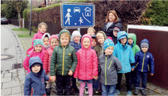
Den Kindern hat der Ausflug sehr viel Spaß gemacht!

Bei einem Spaziergang durch Putzbrunn suchten die Fischekinder der Kita St. Stephan die verschiedenen Verkehrsschilder. Dabei wurden die unterschiedlichen Bedeutungen zusammen mit den Kindern erarbeitet, besprochen und erklärt.