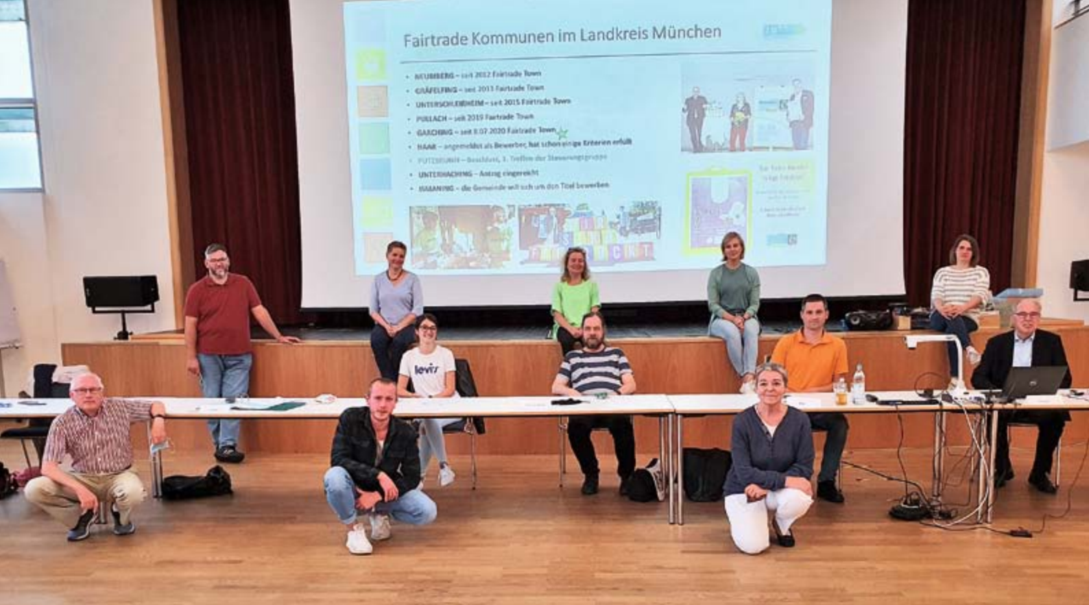
Erfolgreiches I. Treffen der Steuerungsgruppe