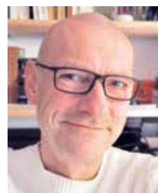
Musiktheorie-Online von Thomas Selbach