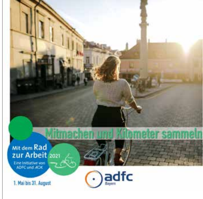
Bild: „Mit dem Rad zur Arbeit“, Copyright, Daria Obyrnaha, Pexels

Die Aktion läuft von 1. Mai bis 31. August 2021, teilnehmen können Berufstätige, die im Aktionszeitraum an mindestens 20 Tagen mit dem Fahrrad unterwegs sind. Auch in diesem Jahr zählen wieder alle Radl-Kilometer, die rund ums Homeoffice