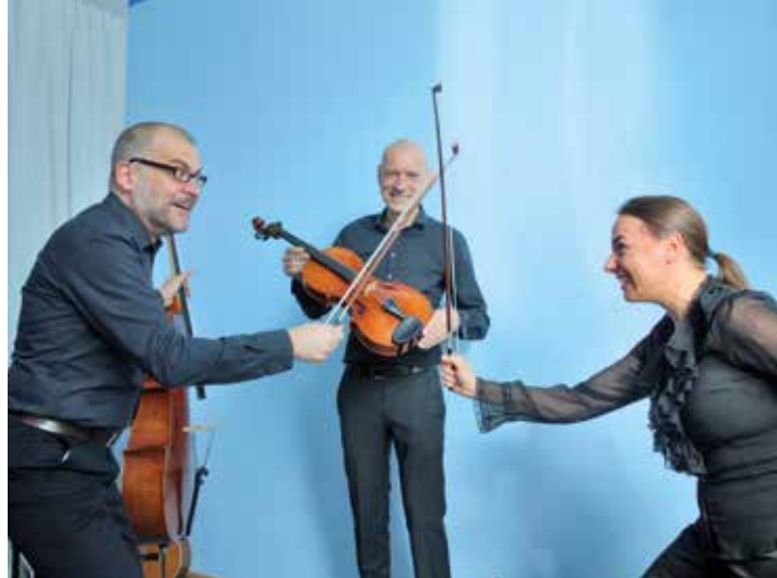
Beethoven Jubiläumskonzert (v.l.n.r.: Wolfgang Fink, Thomas Selbach, Maria Hristova)