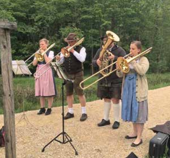
Wald- und Wiesenkonzerte: Corona-Musizieren im Wald