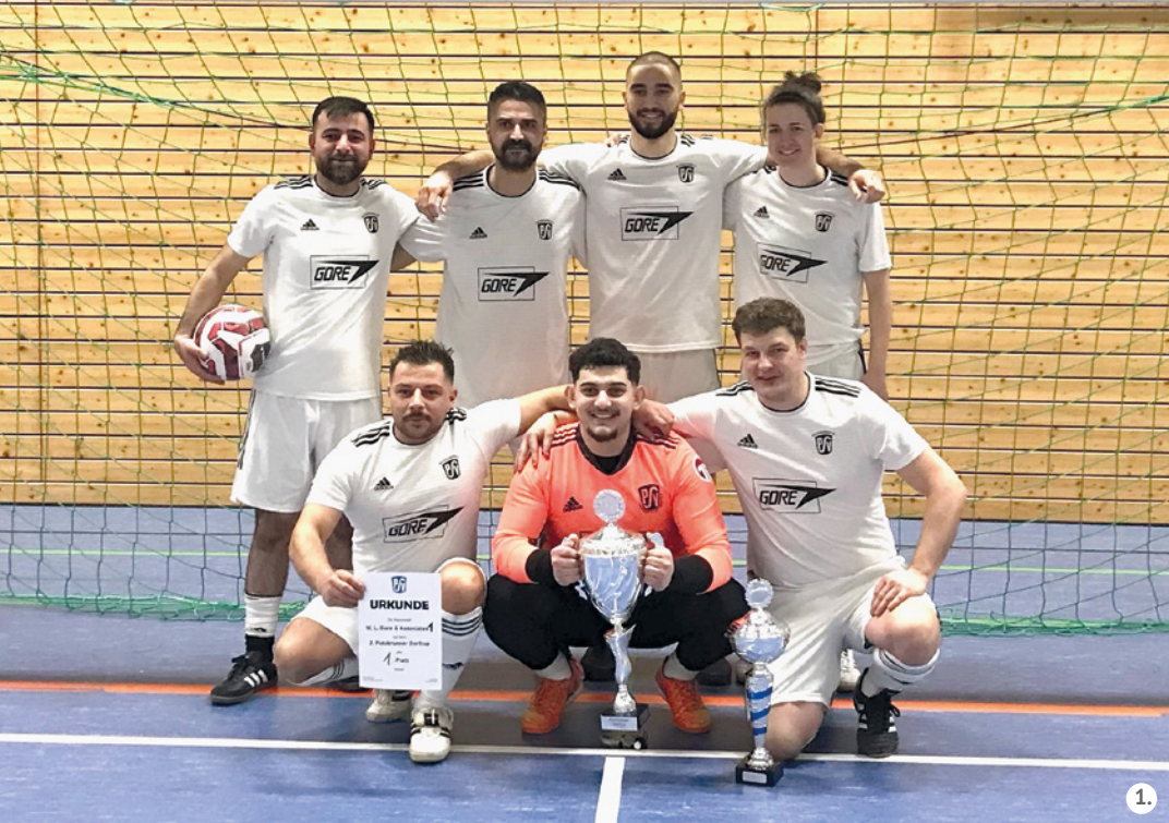
Die Sieger des Turniers: Gore 1