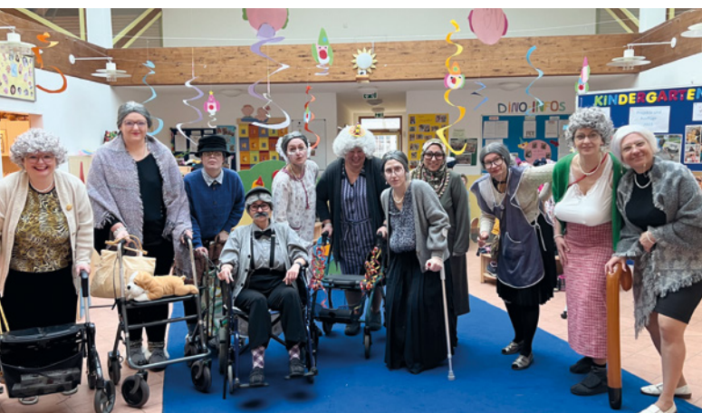
Fasching im Kindergarten an der Rathausstraße - Neue Mitarbeiter jeden Alters sind Willkommen!

Es ist geplant, ab September 2024 eine Kinder-Großtagespflege aufzubauen, um weitere alternative Betreuungsplätze für alle Altersgruppen anbieten zu können. Dabei werden maximal zehn Kinder von 0 bis 14 Jahren in dafür geeigneten Räumlichkeiten betreut. Derzeit können leider noch keine Anmeldungen angenommen werden. Falls Interesse an dieser Betreuungsmöglichkeit besteht, kann eine Vormerkung unter kinderbetreuung@putzbrunn.de gemacht werden.