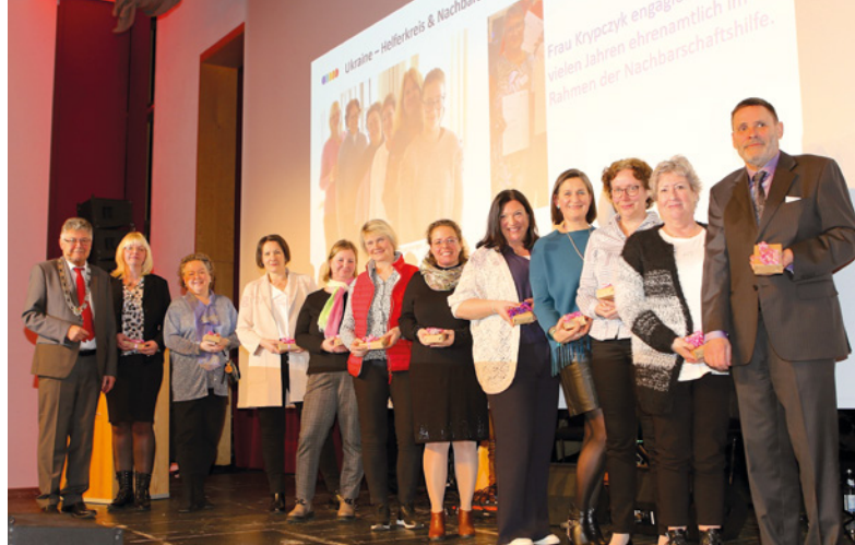
Ukraine Hilfe der Nachbarschaftshilfe