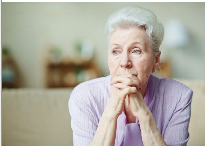
Beim Teilverkauf besteht für die Verkäufer mittelfristig die Gefahr aufgrund der hohen Nutzungsentschädigung in finanzielle Schwierigkeiten zu geraten

Seit wenigen Jahren wird das Modell Teilverkauf angeboten, um im Alter eine finanzielle Unabhängigkeit zu erlangen. Die Vorteile des Teilverkaufs klingen verlockend. Der Eigentümer verkauft nur einen Teil seiner Immobilie, bekommt dafür Geld und kann weiter in seiner Immobilie wohnen bleiben - aber auf die Details kommt es an!