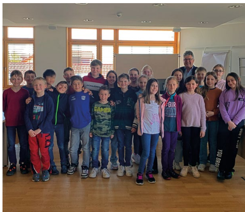
Die Klasse 4b zu Besuch beim Ersten Bürgermeister

Jedes Kind erhielt im Anschluss noch kleine Geschenke von der Gemeinde und schon war der Besuch beim Ersten Bürgermeister wieder vorbei.